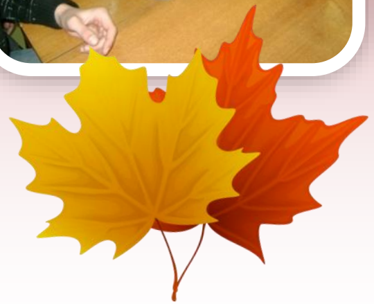
Ты имеешь право