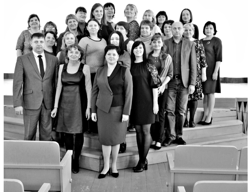
Участники Партнёрского Совета